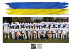
Ucraina Baseball - Ucraina Softball

Selezione lingua Powered by Google Traduttore